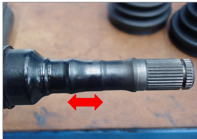
Photo. 4 – Zone de serrage du collier pour un montage correcte du soufflet