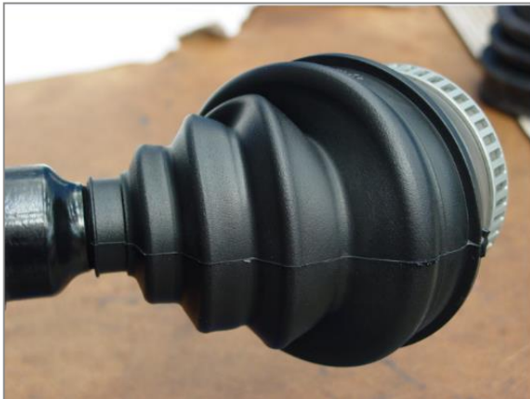
Photo 1 - Serrage incorrect du soufflet

Si le collier est serré trop loin des cannelures (Photo 1) le soufflet s'étirera excessivement et provoquera des fissures (Photo 2).